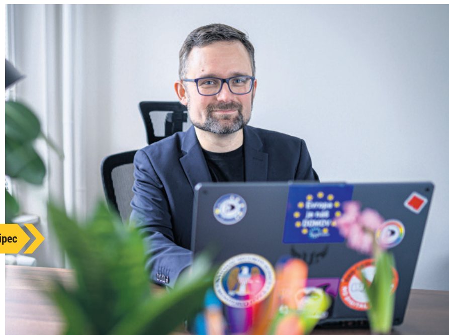
Mikuláš zatnul Babišovi tpec

Víc mluvit do toho, kam mají evropské peníze směřovat. Příliš dotujeme zemědělství či spalování fosilních paliv. Dejme více na investice do budoucnosti – vědu, výzkum, školství, rozvoj infrastruktury a podporu strukturálně postižených regionů. ■