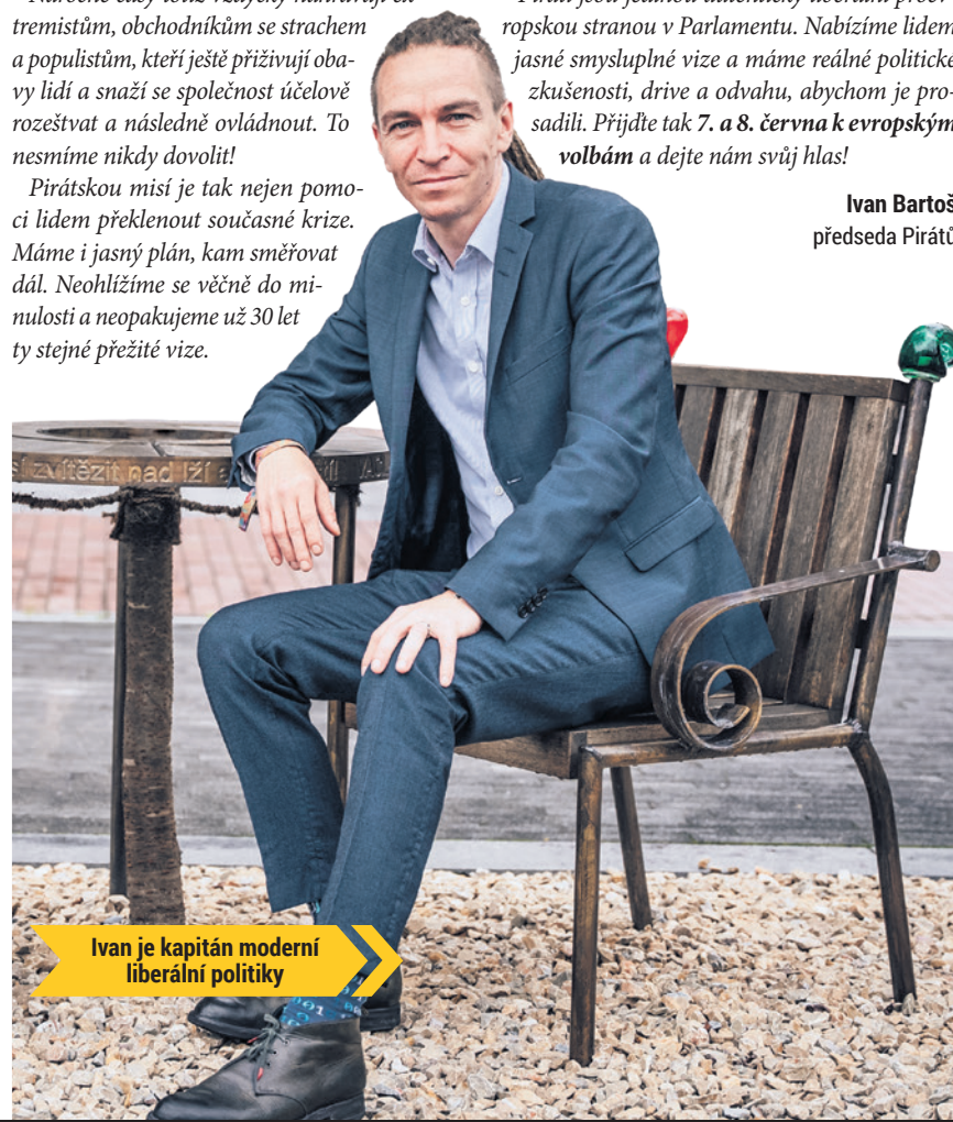
Ivan je kapitán moderní liberální politiky